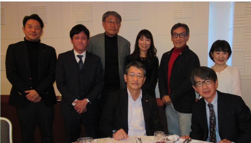
熊本会員へ ロータリー米山記念奨学会より カウンセラー感謝状の贈呈